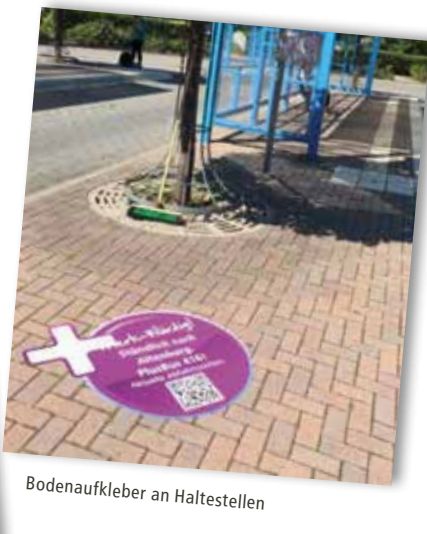
Bodenaufkleber an Haltestellen